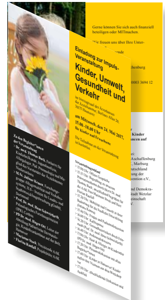
Endergebnis nach Falzen